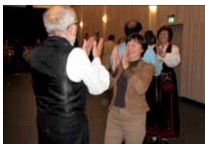
» NITTEDAL - uczyliśmy się tańczyć

Następny dzień spędziliśmy na zwiedzaniu Oslo. Pierwszym punktem wycieczki był skansen, w którym znajdowały się drewniane domy mieszkalne z dawnych czasów, najstarsze pochodzą nawet z XIII w. Nie mogło również zabraknąć spaceru po parku sławnego norweskiego rzeźbiarza Vigelanda, gdzie dziewczyny chętnie pozowały do zdjęć z rzeźbami, a zwłaszcza z najsłynniejszą z nich, przedstawiającą rozszluzzonego chłopca ze złotą rączką. Rzeźba zasłynęła tym, że jest często kradziona, ale zawsze wraca na swoje miejsce do parku. Duże wrażenie zrobiło na nas Centrum Pokoju – muzeum poświęcone Alfredowi Noblowi oraz laureatom pokojowej nagro-