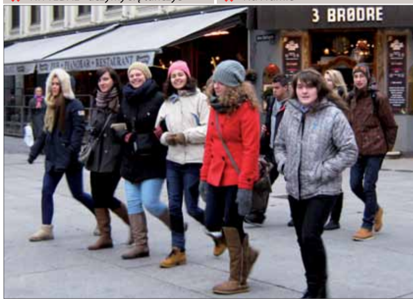
» NITTEDAL - na ulicach Oslo

dy Nobla. Największą jednak atrakcją było oglądanie skoczni w Holmenkollen, której rekord pobił Adam Małysz. Zwiedziliśmy także siedzibę organizacji „Fokus” zajmującej się pomocą dla kobiet z krajów trzeciego świata.