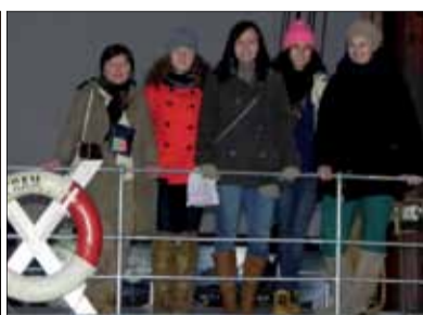
» Na Framie