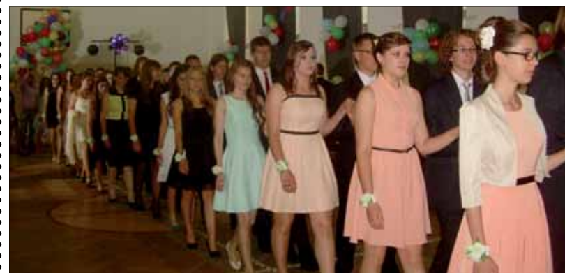
➔ ZSP 6, fot. Hanna Wolniewicz