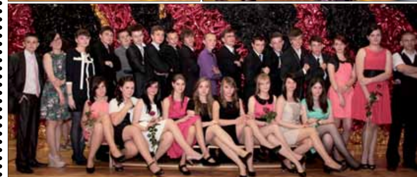
➔ ZSP 7, fot. Sylwia Kozłowska