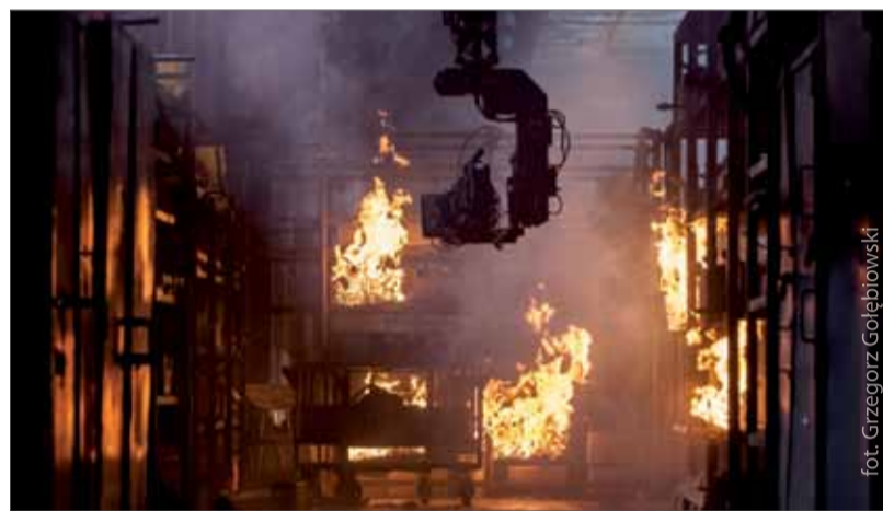
» Kadr z serialu „STRAŻACY”

dzięki którym pozytywny wizerunek miasta przedostaje się do branży filmowej. Nie bez znaczenia jest też rola funkcjonującej w naszym mieście filii Szkoły Wajdy. To właśnie współpraca z Andrzejem Wajdą zaoferowała realizację w Żyrardowie zdjęć do filmu „Wałęsa”.