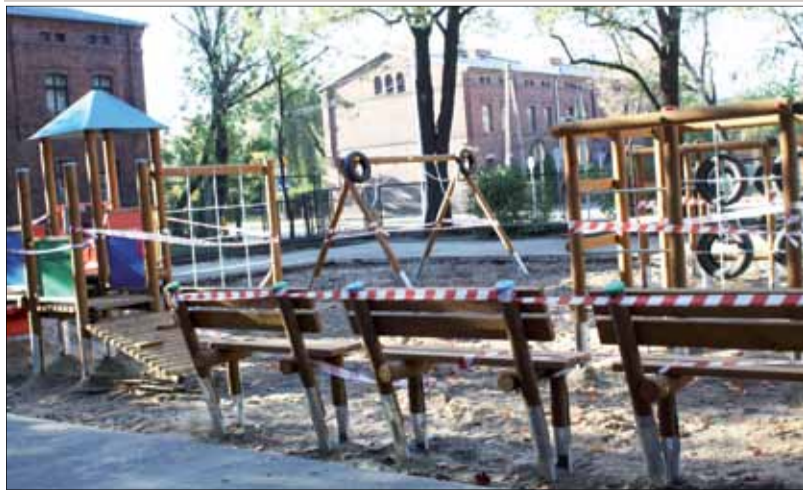
» Zespół Szkół Publiczny Nr 2