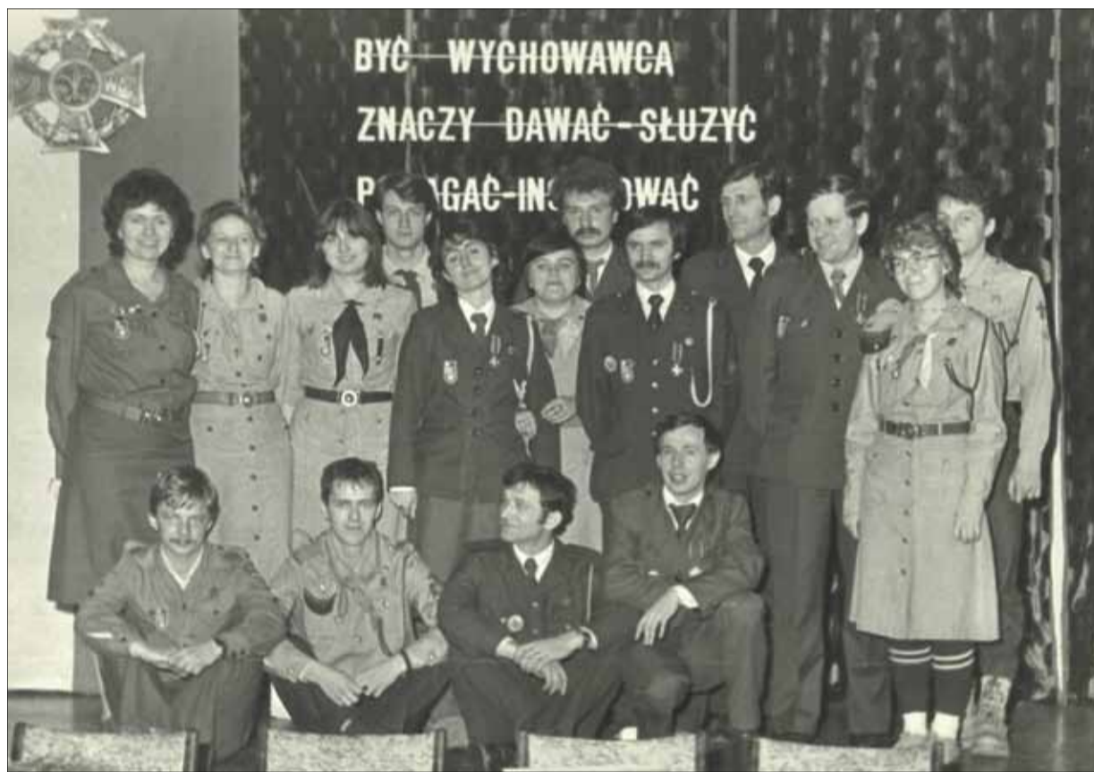
» Rada Hufca ZHP Żyrardów, 1984r.

cerskiej. Nasze zespoły wyróżniały na festiwalach chorągwiowych i centralnych. Obok kultury, dużym zainteresowaniem cieszył się sport i turystyka. Harcerze uczestniczyli w wielu rajdach ogólnopolskich. Interesującą działalność prowadził w Hufcu Harcerski Bank Usług przy Zespole Szkół Zawodowych, którego zadaniem było niesienie pomocy ludziom starszym, samotnym i chorym. W tym okresie intensywną działalność prowadził też Retmanat Drużyn Wodnych. Organizował szkolenia na stopień żeglarza i sternika jachtowego. Z inicjatywy instruktorów Retmanatu z naszego Hufca powstał Wojewódzki Oddział Ligi Morskiej w Żyrardowie. W 1983 r. została nawiązana współpraca z dowództwem Marynarki Wojennej w Gdyni i załogą M/S Żyrardów. Największym wydarzeniem w tej kadencji była Kampania „Bohater Hufca”. 30 września 1985 r. zuchy, harcerze i instruktorzy rozpoczęli kampanię Rajdem do Bud Zosinych, a uroczyste nadanie imienia