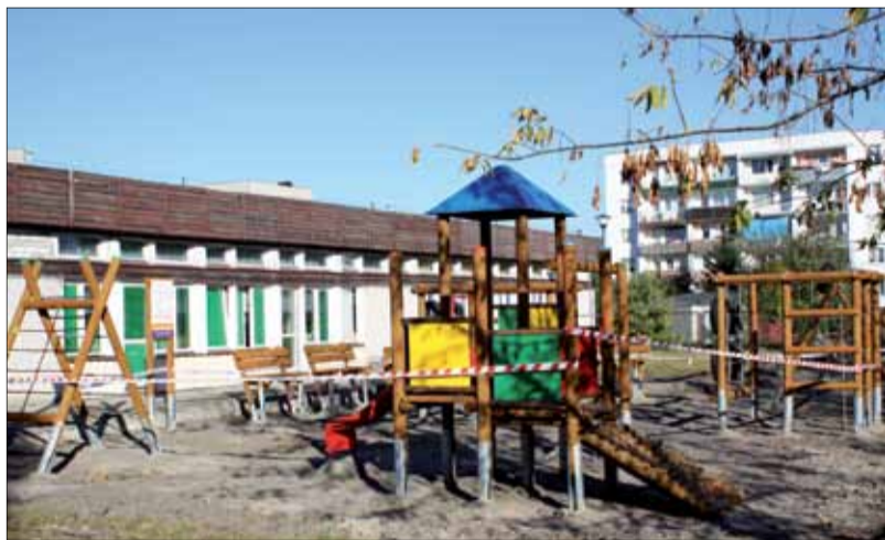
» Zespół Szkół Publiczny Nr 3 (tzw. „mała Trójka”)